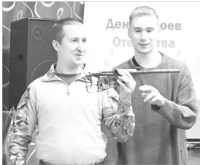
Поисковики отряда «Свирский рубеж» рассказали школьникам о своей работе

Говорили на встрече и о том, что подвиги обычных людей зачастую малозаметны, но в сердцах их близ-